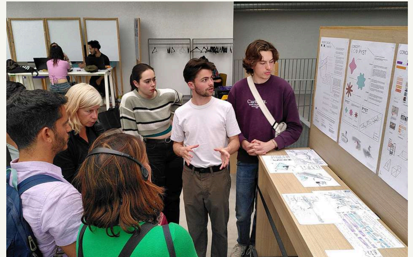
Projet long « ville non-sexiste », en partenariat avec Nantes Métropole (2023)