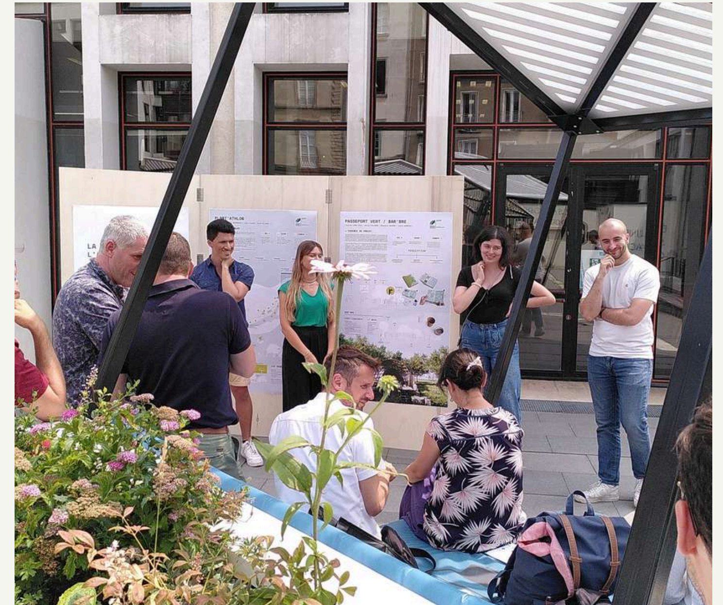
Projet long « arbres et citoyens », en partenariat avec Nantes Métropole (2023)